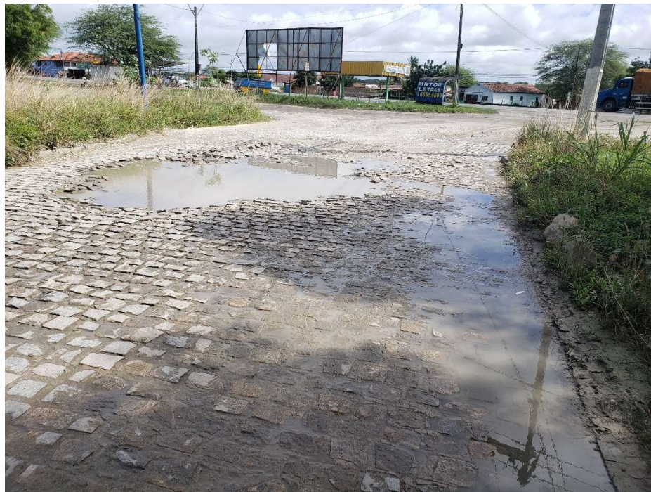
Foto 12 – Acumulo de água na rua Vista da rua Julia Maciel Eulalia