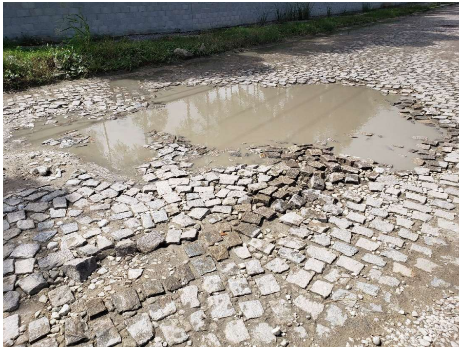
Foto 11 – Pavimento danificado da rua Vista da rua Julia Maciel Eulalia